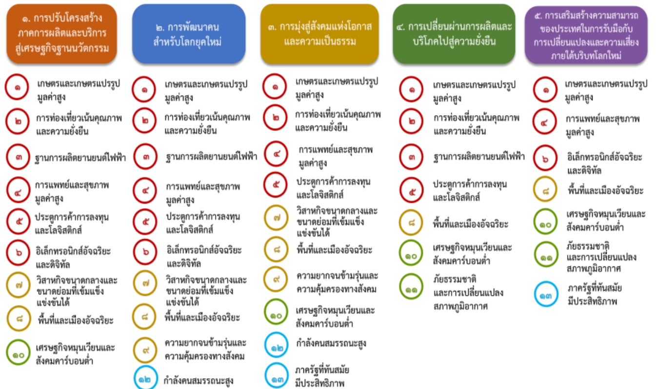
แผนภาพที่ ๓.๑ ความเชื่อมโยงระหว่างหมวดหมู่การพัฒนากับเป้าหมายหลัก

ความเชื่อมโยงระหว่างหมวดหมู่การพัฒนากับเป้าหมายหลักแสดงไว้ในแผนภาพที่ ๓.๑ โดยหมวดหมู่ การพัฒนาที่กำหนดขึ้นเป็นประเด็นที่มีลักษณะเชิงบูรณาการที่ครอบคลุมการพัฒนาตั้งแต่ในระดับต้นน้ำจนถึง ปลายน้ำ และสามารถนำไปสู่ผลพัฒนาทั้งในมิติเศรษฐกิจ สังคม ทรัพยากรธรรมชาติและสิ่งแวดล้อมไปพร้อมๆ กัน ทำให้หมวดหมู่แต่ละประการสามารถสนับสนุนเป้าหมายหลักได้มากกว่าหนึ่งข้อ นอกจากนี้การพัฒนาภายใต้ แต่ละหมวดหมู่ไม่ได้แยกขาดจากกัน แต่มีการสนับสนุนหรือเอื้อประโยชน์ซึ่งกันและกัน