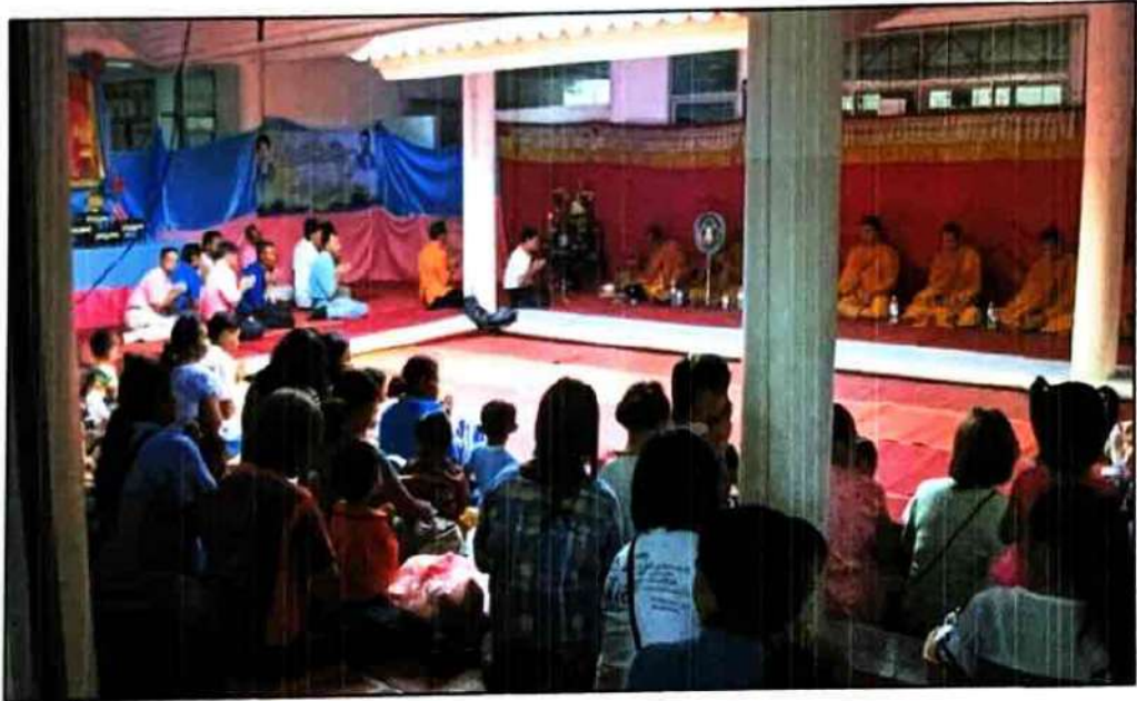
ผู้มีเกียรติถวายเครื่องไทยธรรมแด่พระสงฆ์ที่ร่วมพิธีเจริญพระพุทธมนต์