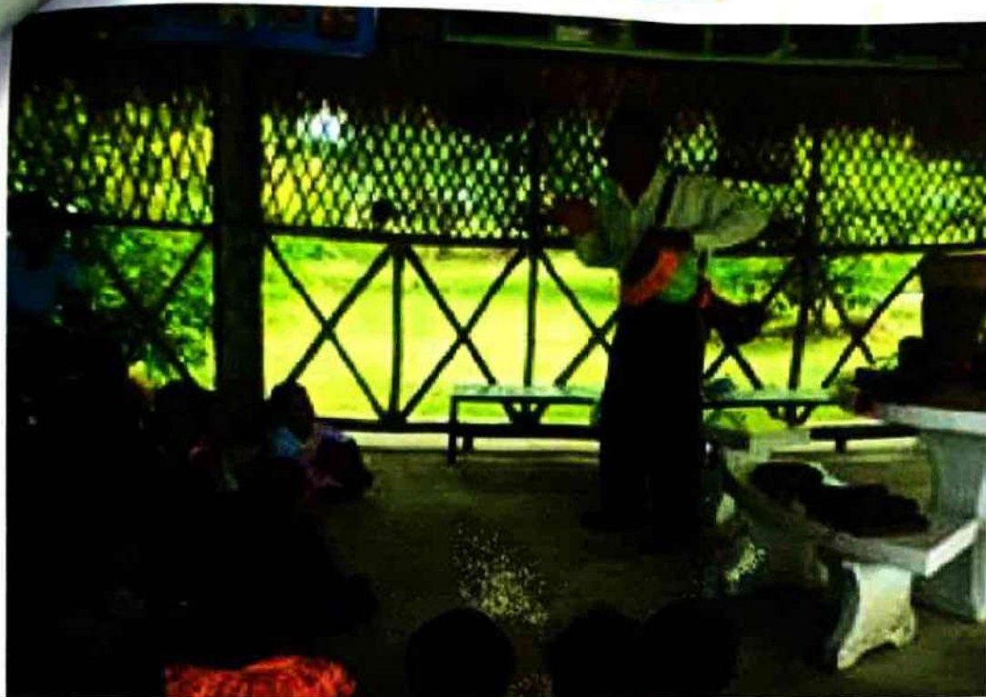
ปราชญ์ชาวบ้านมาให้ความรู้กับเด็กๆเกี่ยวกับดนตรีพื้นบ้าน