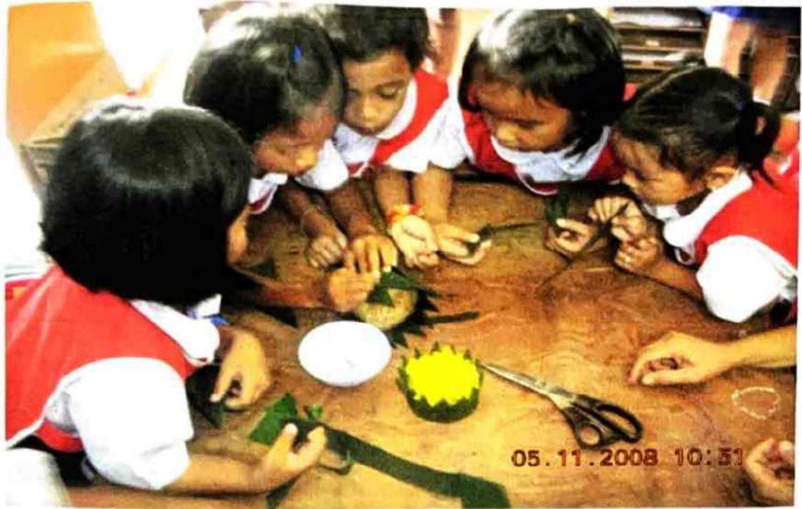
รูปภาพลอยกระทง