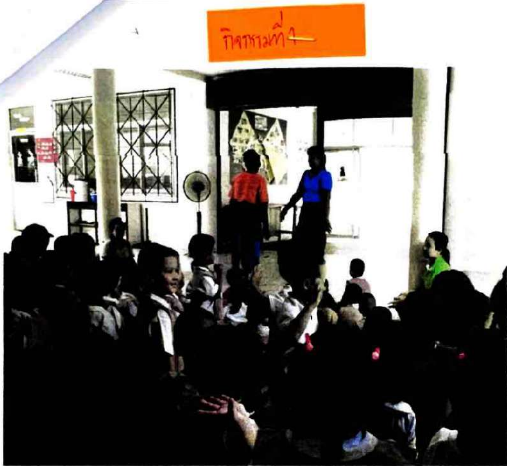
ปราชญ์ชาวบ้านมาให้ความรู้เพลงโครมพร้อมสาธิตการแสดง