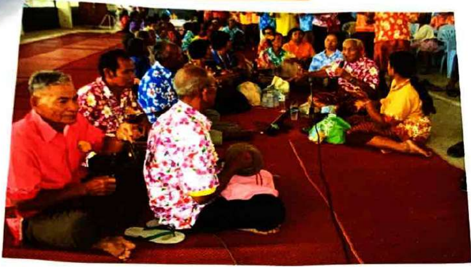
ทำโทนกิจกรรมส่งเสริมศิลปวัฒนธรรม